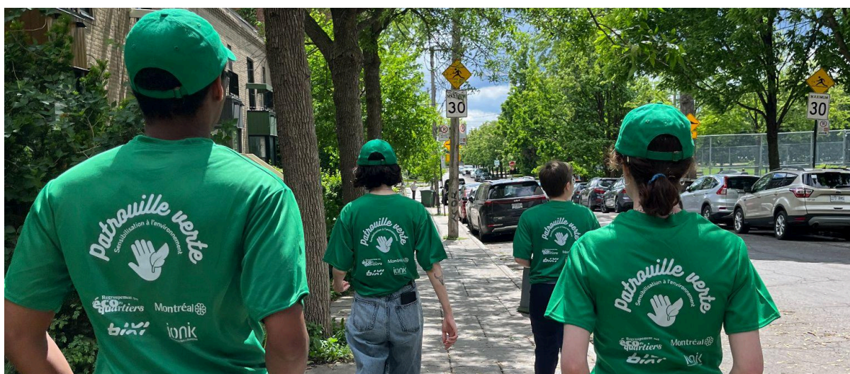
Figure 3 : Les patrouilleur.euse.s dans les rues de Montréal.

Pour en savoir plus : https://www.eco-quartiers.org/patrouille-verte