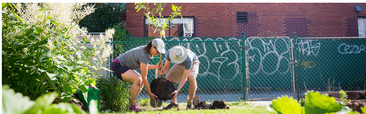
Figure 1 : Une des photos officielles de la campagne Un arbre pour mon quartier.

Pour en savoir plus : https://unarbrepourmonquartier.org/