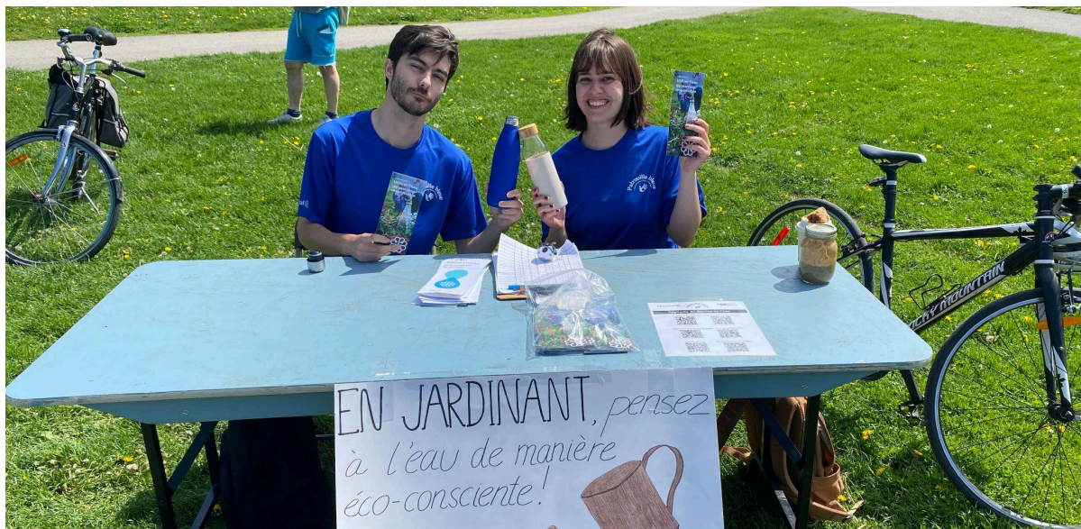
Figure 2 : Les patrouilleur.euse.s à Villeray-Saint-Michel-Parc-Extension.

Pour en savoir plus : https://www.eco-quartiers.org/patrouille-bleue