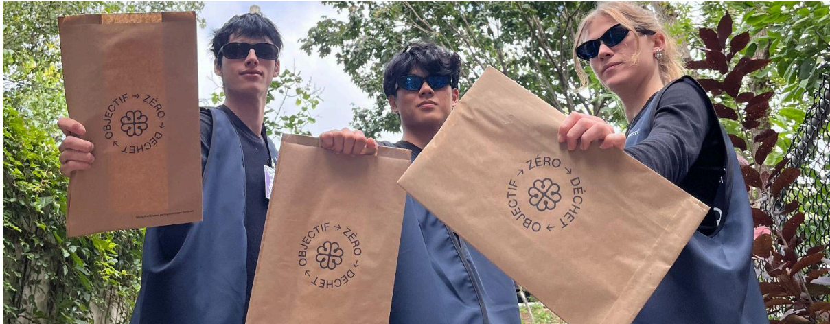
Figure 7 : Photo officielle des agent.e.s de l'escouade.

Pour en savoir plus : https://www.eco-quartiers.org/escouade-secrete-zero-zero-dechet