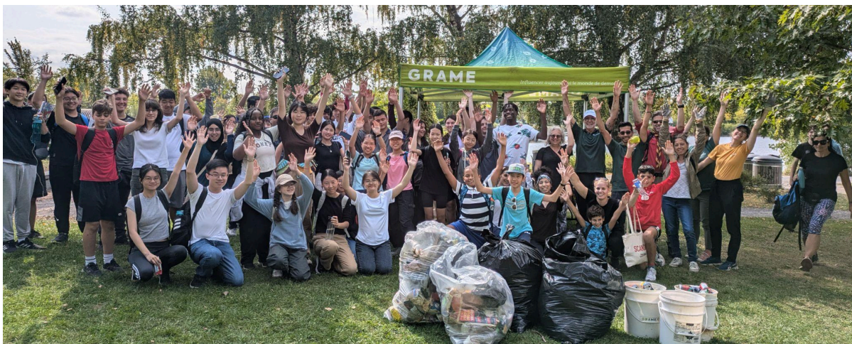
Figure 6 : Les citoyen.ne.s lors de la corvée de nettoyage à Lachine, organisée par le GRAME.

Pour en savoir plus : https://www.eco-quartiers.org/journee-du-fleuve